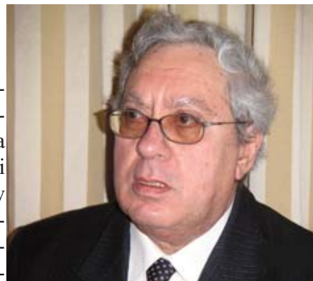
Professor Oliver Friggieri

Isqof tieghu. Huwa jhallas prezz gholi hafna ghal dan. Susanna, l - o m m z a g h z u g h a m h u x - m i z z e w g a , tghaddi minn tbatija kbira, izda ommha, i n - n a n n a suprema, il- m e x x e j j a morali tal-familja estiza, jirnexxilha tpoġgi kollox f’postu.