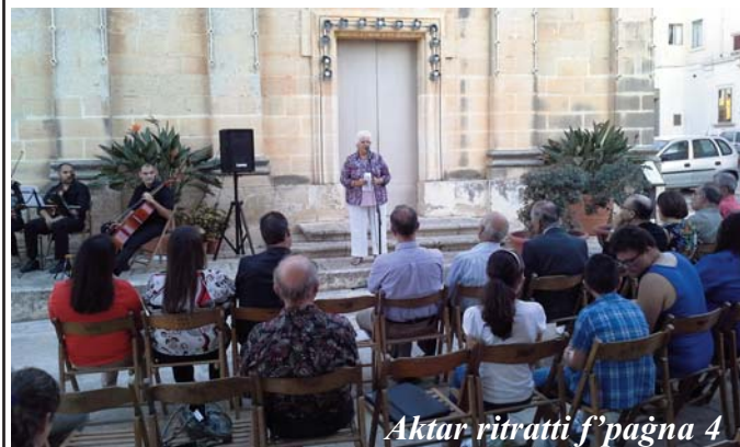
Aktar ritratti f'paġna 4