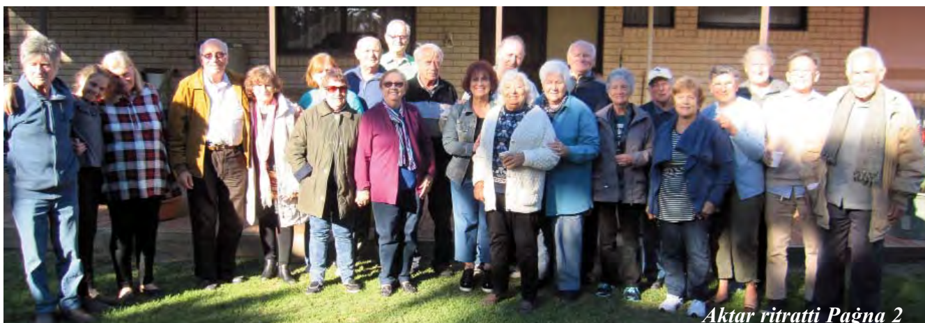
Aktar ritratti Paġna 2

Editor: Paul Vella paul.vella44@gmail.com